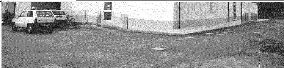
UNA MENSA PER I POVERI. IN ALTO: IL DORMITORIO DEL LAZZARETTO