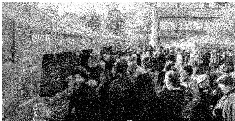
PIAZZETTA Cineteca presa d'assalto, ieri mattina, per il primo 'farmer market' della città che avrà cadenza mensile. Prossimo appuntamento il 13 dicembre

ALLE STELLE Un italiano spende per mangiare 6,77 euro a Bologna ne servono 7,34