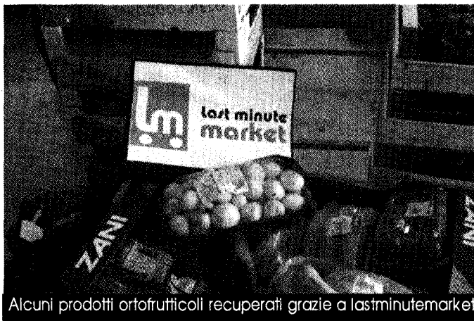
Alcuni prodotti ortofruttili recuperati grazie a lastminutemarket

Recuperando le eccedenze di grande e piccola distribuzione in Italia si potrebbero salvare all'anno 244.252 tonnellate di cibo per un valore di 928.157.600 euro. Sarebbe inoltre possibile fornire tre pasti al giorno a 636.600 persone (gli abitanti della provincia di Modena, ndr) e risparmiare 291.393 tonnellate di CO2 prodotte a causa dello smaltimento del cibo di risulta come rifiuto